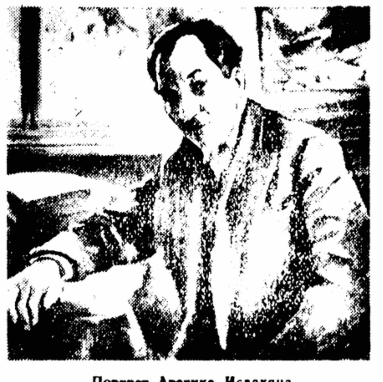
Портрет Аветика Исаакяна

Я вспоминаю, как на различных выставках, окруженные огромными полотнами других художников, сверкали пейзажи Сарьяна. Мне они тогда казались оазисами. Мы дожили до большого праздника: впервые мы видим весь творческий путь замечательного художника.